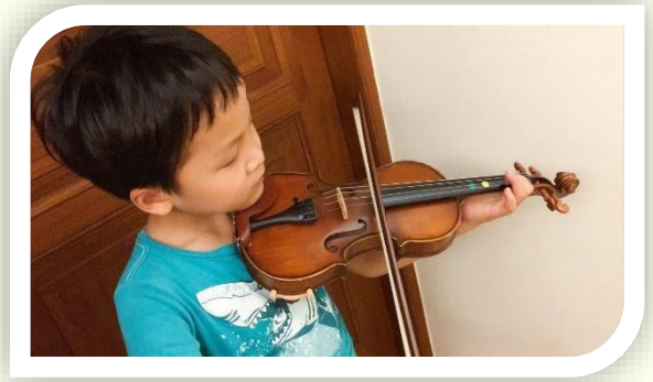
圖片一：大班的孩子，練習拉奏小提琴。

回想起我幼兒時期接受的音樂教育，充滿了愉快的經驗。我生長在一個愛樂的家庭，從小常在父親的吉他伴奏聲中一起快樂的歌唱。四足歲時，進入山葉音樂教室幼兒班上團體課，上課的氣氛非常開心。印象中，一群小朋友常常在老師的伴奏之下，跟著老師唱歌、玩律動遊戲、聽故事。教室裡有每人一台專屬的電子琴，上面放著小樂器，有三角鐵、鈴鼓、響板、和手搖鈴。我們也常跟著老師播放的音樂，拿起小樂器大合奏，或是在電子琴上彈奏簡單的旋律，隨著老師播放的音樂一起合奏。課本上，也有一些讓我們畫畫的地方。下課時，老師都會發下可愛的小貼紙當作獎勵。在課堂上，老師設計了幾段音樂，代表特定的意義。譬如：老師演奏音樂 A 的時候，大家就要離開自己的座位，到教室中間集合囉！而聽到音樂 B 的時候，則是代表下課前發貼紙囉！現在回想起來，這也是藉由音樂，訓練幼兒聽力的一個方式。