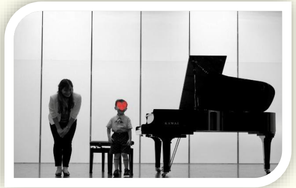
圖片二：中班的小朋友，也可以在老師陪伴下，一起上台演奏鋼琴喔！

在學習音樂的路上，能培養孩子的音樂美學素養，與引導出興趣，恐怕比急於練就高超的演奏技巧來的重要。有了對音樂的興趣與成就感，孩子才會願意繼續學習；學習音樂的路，才可能因著對音樂的喜愛而走得長久。